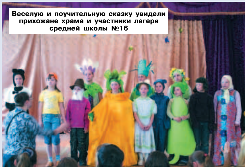
Веселую и поучительную сказку увидели прихожане храма и участники лагеря средней школы №16