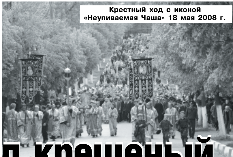
Крестный ход с иконой «Неупиваемая Чаша» 18 мая 2008 г.

Определение подписано Святейшим Патриархом Алексием и 15 архиереями Русской Православной Церкви