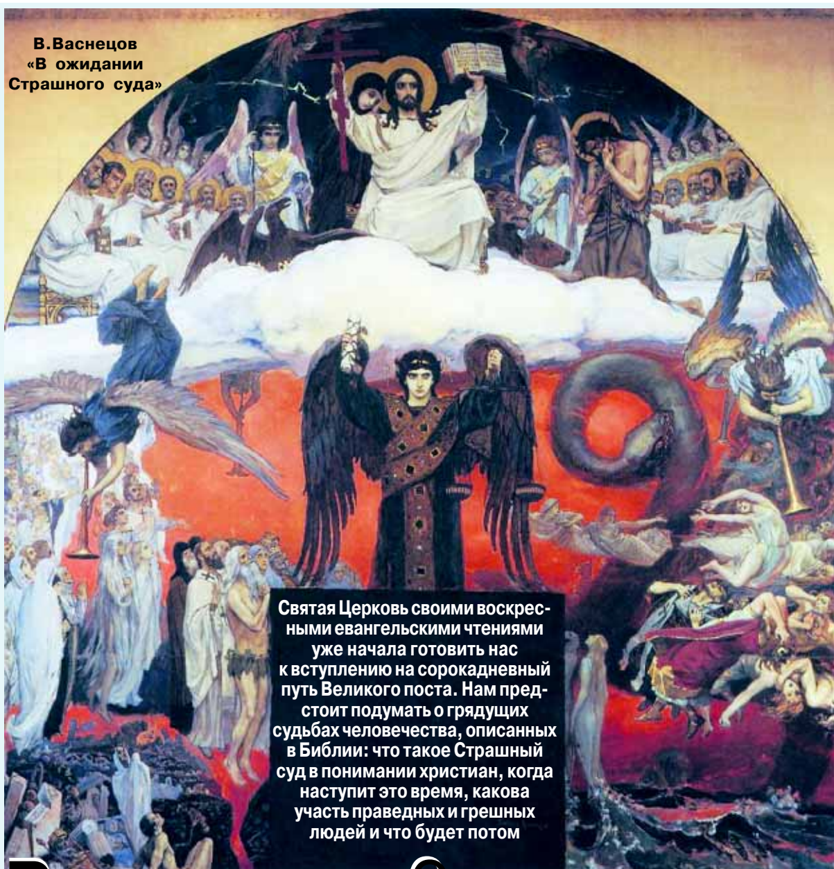
В. Васнецов «В ожидании Страшного суда»

Святая Церковь своими воскресными евангельскими чтениями уже начала готовить нас к вступлению на сорокадневный путь Великого поста. Нам предстоит подумать о грядущих судьбах человечества, описанных в Библии: что такое Страшный суд в понимании христиан, когда наступит это время, какова участь праведных и грешных людей и что будет потом