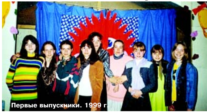
Первые выпускники. 1999 г.

Сколько было всего интересного: и сами занятия, и службы, и постановка сказок к большим праздникам. Сейчас первые выпускники, которых было чуть больше десяти человек, уже водят в храм своих маленьких деток, молятся сами, поют на клиросах и помогают в алтаре. В их аттестатах об окончании школы имелся вкладыш, который свидетельствовал о том, что в процессе обучения дети ознакомились с одиннадцатую(!) дисциплинами в разных сферах церковного образования. И Закон Божий, и церковно-славянский язык, богослужебное пение и история России, сольфеджио, хоровое пение - по всем предметам прошла серьезная аттестация и