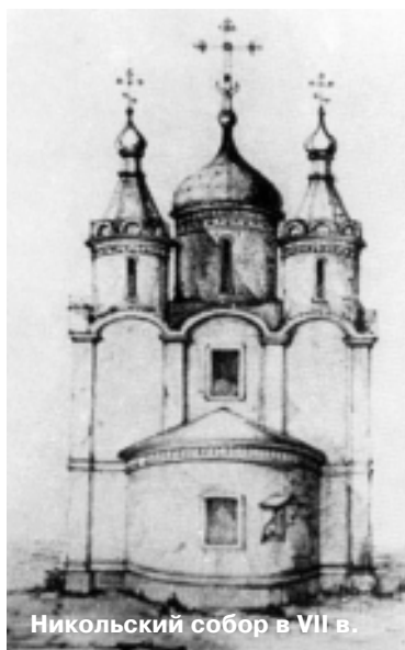
Никольский собор в VII в.