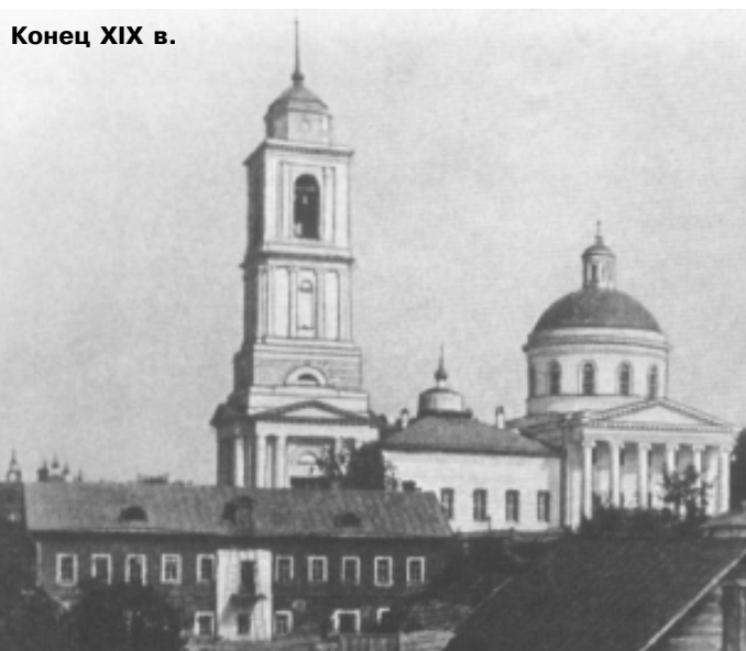
Конец XIX в.