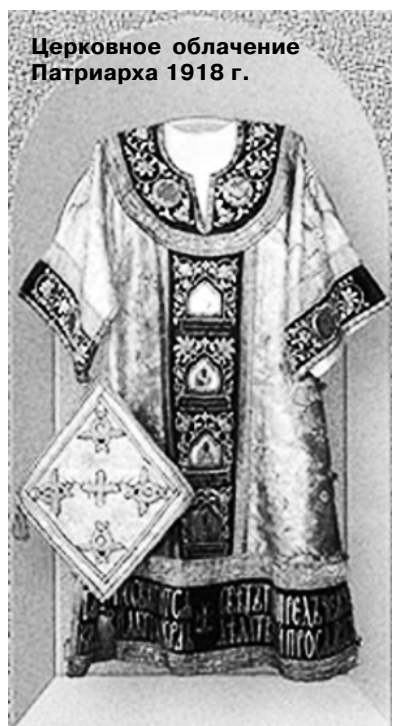
Церковное облачение Патриарха 1918 г.

Составлено по материалам сети Интернет и статьи А. МОСОЛОВА «История одной фотографии»