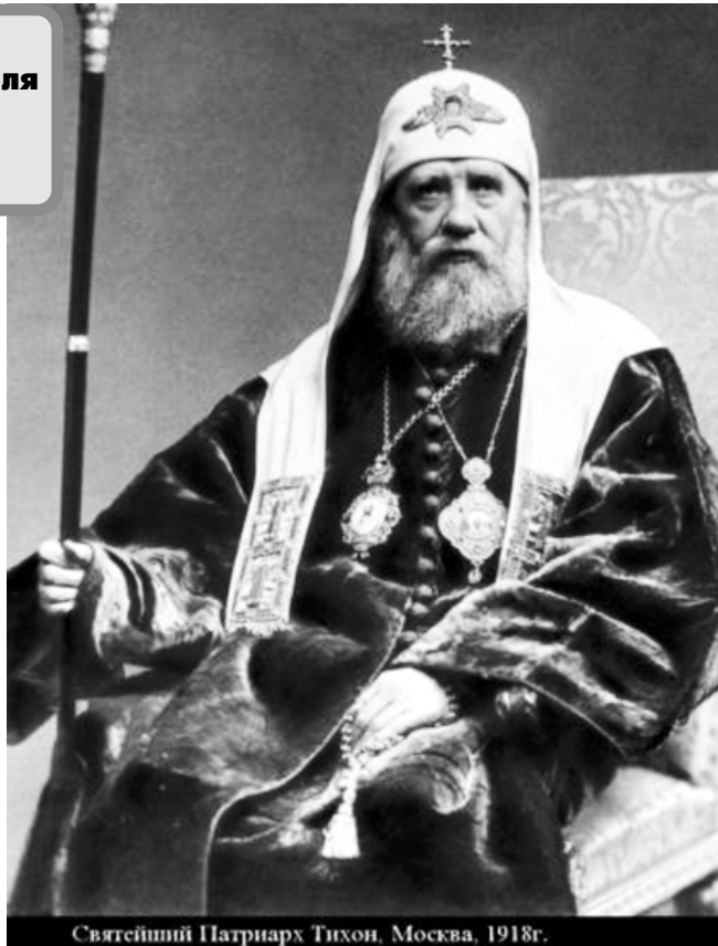
Святейший Патриарх Тихон, Москва, 1918г.

В асилий Иванович Белавин родился 19 января 1865 года в селе Клин Торопецкого уезда Псковской губернии, в благочестивой семье священника. Когда Василий был еще малолет-