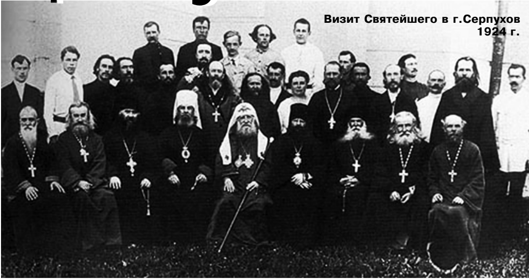
Визит Святейшего в г.Серпухов 1924 г.

В 1917 г. было решено восстановить патриаршество. Перед Владимирской иконой Божией Матери, принесенной из Успенского собора в храм Христа Спасителя, после торжественной литургии и молебна 5 ноября схииеромонах Зосимовой